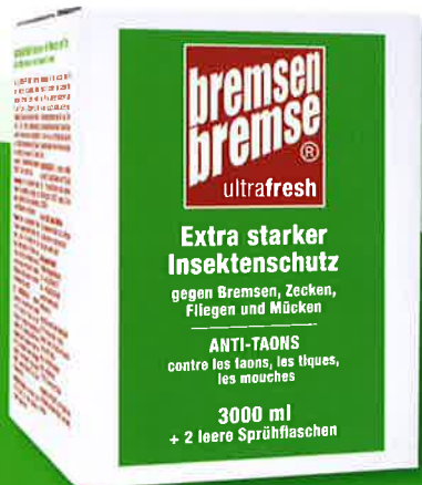
BREMSENBREMSE® ultrafresh 3000 ml Nachfüllpack inkl. 2 Leerflaschen.